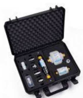
Kalkschutz24 Apparatur kann für saubere Rohrleitungen sorgen

11.09.2020 - 10:11 | Handel, Wirtschaft, Finanzen, Banken & Versicherungen auf openPR.de Pressemitteilung von: Bionic-Innovations PLC / PR Agentur: Bionic-Innovations PLC