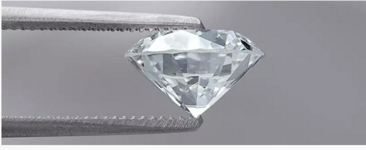
Predator Capital & Management Group Ltd.