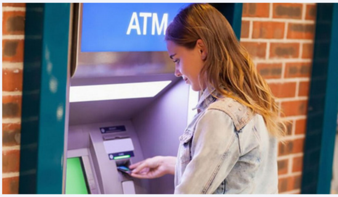
Sie können Ihren eingeräumten Disporahmen von bis zu 50.000 Euro bequem an jedem Geldautomaten abheben.